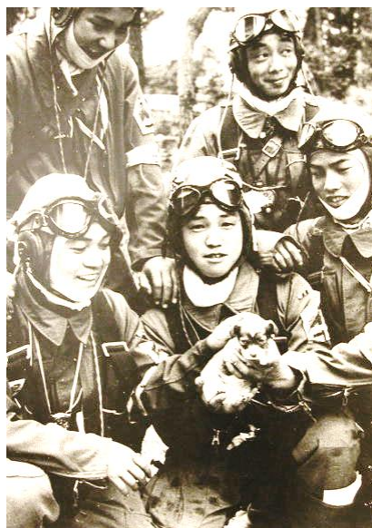
子犬を抱く出撃前の少年たち

昭和20年5月26日に写されたものと思われる。その翌日早朝5人は沖繩へ出撃した。その一人が宿舎から父親に1枚のハガキ送っている。その差出日は出撃当日(昭和20年5月27日)の消印と宿舎の住所が川辺郡加世田町飛龍荘内と書かれている。文面も「最後の便りに致します」ではじまり「弟達及隣組の皆様宜しく、さようなら」としたためられている。